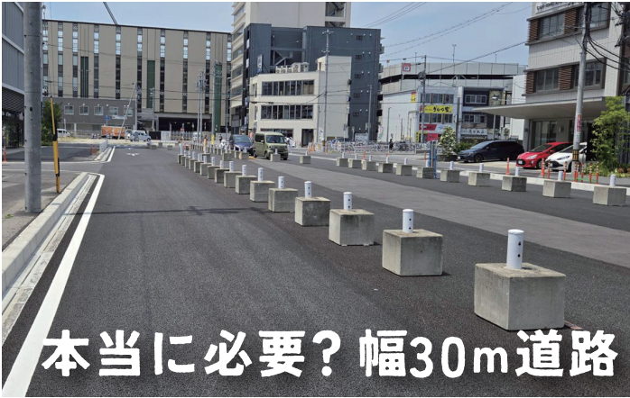
本当に必要？ 幅30m道路