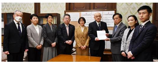
参院事務総長(右から4人目)に企業・団体献金全面禁止法案を手渡す共産党議員団

共産党は昨年12月に企業・団体のパーティー券購入も禁止する企業・団体献金全面禁止法案を参院に提出。企業・団体献金を1円も受け取らない共産党ならではの提案として注目されている。