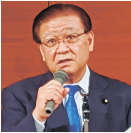
市田忠義 日本共産党副委員長

発行所 日本共産党愛知県委員会 〒460-0007 名古屋市中区新栄三丁目12番25号 ☎(052) 261-3461 (代表) (052) 251-2925 (編集部) F A X (052) 261-6063 定価 月 400円 郵送料 336円 1部 100円 毎週日曜日発行 (第5日曜日は休刊)