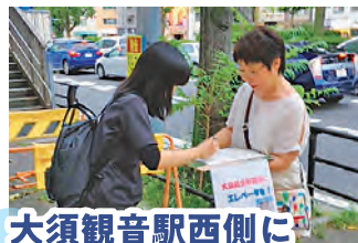
大須観音駅西側に エレベーター設置を

「子どもたちの遊び場がなくなる」と周辺の保育園や学童保育所から切実な声。遊び場の少ない中区では貴重な大きな木が茂り、砂のある公園です。子どもは泥団子を作る名人。その子たちのためにも市長や中区に対して要望を出しています。