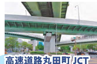
高速道路丸田町 JCT 新設工事に異議あり

「改札口から地上まで 78 段の階段はとてつらい」 ——2019 年 8 月より大須一丁目の方々協力し、署名活動を実施。910 筆の署名を 20 年 2 月の市議会へ提出。名古屋市は 1 路線のみが通る駅でのエレベーターの設置について現在調査中で、保留となっています。