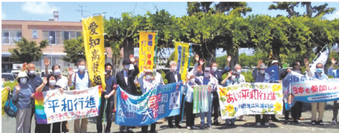
静岡県から愛知県への横断幕の引き継ぎ式=5月31日、静岡県湖西市

自治体首長や議会議長らからも賛同の署名やペナント・メッセージが寄せられました。3日の知立市役所前で