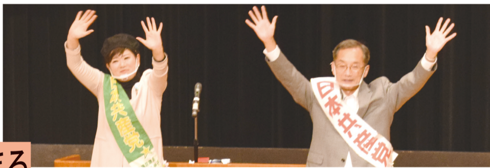
愛知1区で野党共闘の演説会を開催する(左から)もとむら、しまづの各氏＝4日、名古屋市

1987年生まれ。東京農業大学短期大学部卒。日本民主青年同盟東京都委員会副委員長。2017年総選挙で東京8区から立候補。現在、党愛知県青年学生副部長、党愛知県委員。