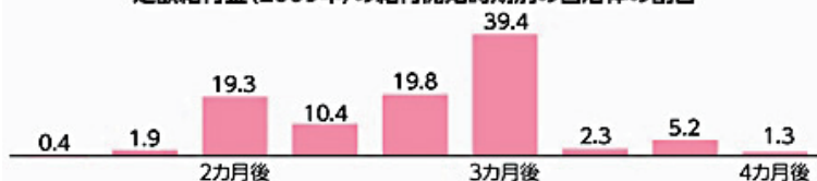
定額給付金(2009年)の給付開始時期別の自治体の割合

総務省資料から作成。補正予算成立(1月27日)から数えた給付開始時期別の自治体の割合、単位：%