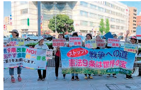
市民の願いを市政にと、市民との共同を大切にがんばっています

「憲法9条を守ろう」「消費税10%増税ノー」「原発をゼロにして再生可能エネルギーの普及を」ー平和と民主主義、暮らしを壊す安倍政権の暴走をストップさせるため、名東区のみなさんとともに草の根の運動にとりくんできました。