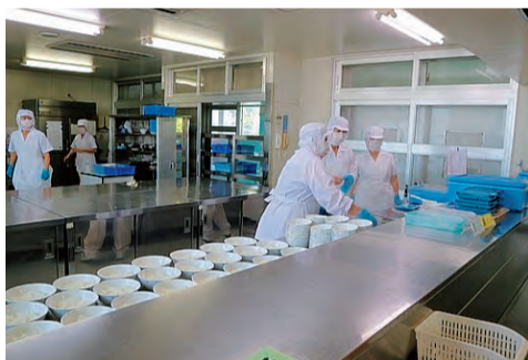
小学校の調理場を調査しました

中学校のスクールランチは民間調理場方式。子どもたちの声にもとづいて「あたたかいスクールランチを」と抜本改善を要求、自校方式や親子調理場方式での給食を提案しました。また、小学校給食調理業務の民間化に反対し、議会の質問で「自校調理方式に戻すべき」と求めました。