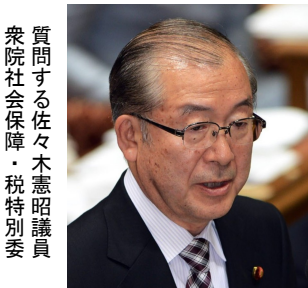
質問する佐々木憲昭議員 衆院社会保障・税特別委

佐々木議員は、高齢者夫婦世帯とサラリーマン世帯の苦しい家計実態を示しながら、消費税増税によって国民生活と日本経済に大きな衝撃をおよぼすと追及。