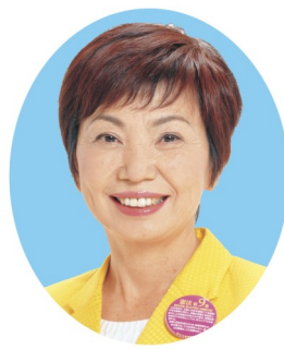
八田ひろ子元参院議員