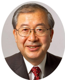
佐々木憲昭衆院議員