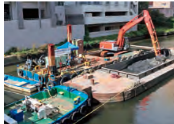
鵜橋付近でヘドロの浚渫工事を行う作業船