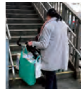
大須観音西側から荷物とベビーカーを抱え歩道橋で地下鉄EVに向かうママ。

中日ビル取り壊しに伴い、地下街から区役所へのエレベーターが不便に。大須観音西側のエレベーター設置も切実です。