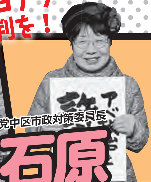
党中区市政対策委員長