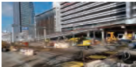
JR名古屋駅ではリニアの地下駅工事が進み、周辺の開削工事や名古屋城南の非常口工事など、膨大な掘削土砂の運搬による影響が心配されています。

減税日本 不祥事続きで、離党や議員辞職相次ぎ、4年前12人→現在7人に。市長提案に賛成するだけのイエスマン。