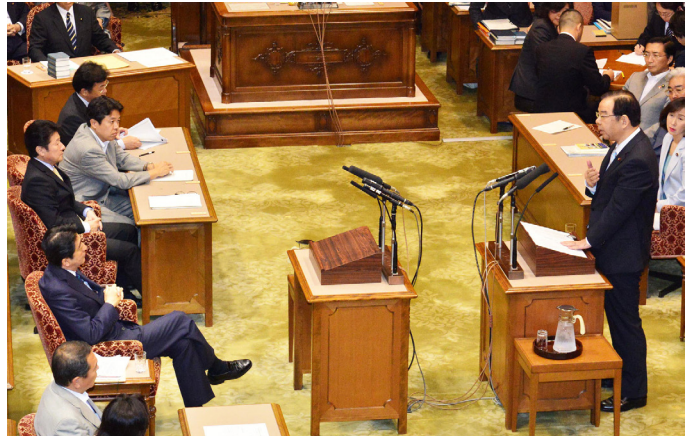
党首討論を行う志位委員長(右)

志位氏は、「武力行使との一体化」論について「国際法上は…確立した概念が存在するわけではございません」(外務省の東郷条約局長)とした1999年の政府答弁を引用し、「国際法上は概念そのものが存在しない。(一体化という考え方の)英訳すら確定したものがない」と指摘。「政府の議論は『世界で通用しない』議論ではないか」と迫りました。