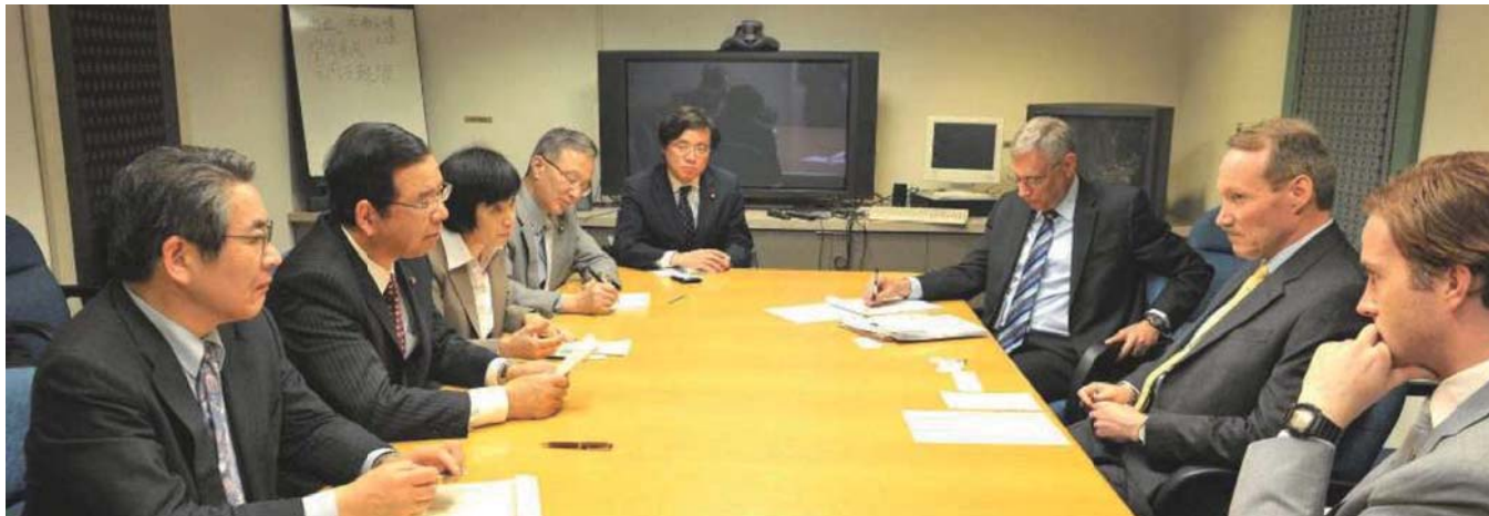
日本共産党の志位和夫委員長は、5月7日、米国防務省内で普天間基地の問題でケビン・メア同省日本部長と会談しました。(写真上)