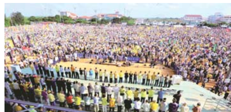
9万人が参加した沖縄県民大会(4月25日)

普天間基地について、志位委員長は、普天間基地『移設』先探しは完全に破たんしたとして、自身も参加した9万人が集まった沖縄県民集会のことを語り、「日本国内どこにも『地元合意』を得られる場所はない。普天間問題解決の唯一の道は、移設条件なしの撤去しかない」と語りました。アメリカ側も、異なる立場でも意見交換をしていくということでも一致しました。