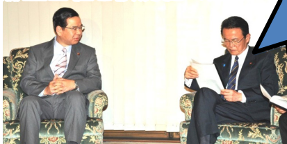
志位委員長(左)と会談する麻生首相(右)。